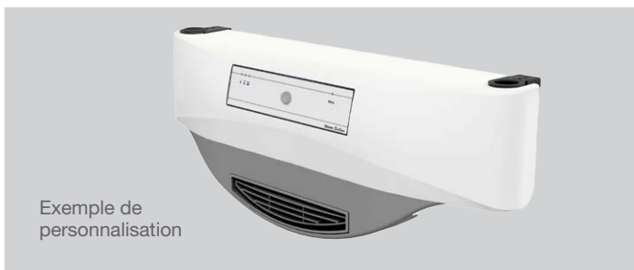
Exemple de personnalisation