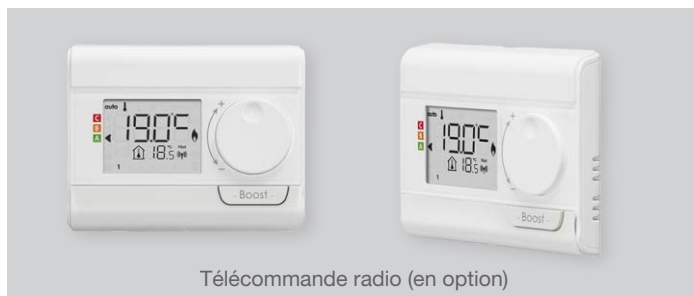
Télécommande radio (en option)