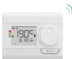
Télécommande RF optionnelle