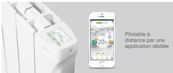
Pilotable à distance par une application dédiée