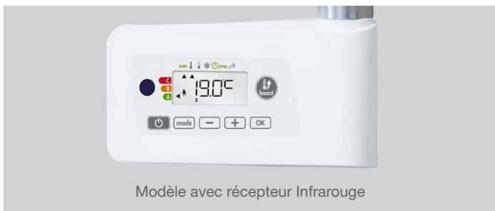
Modèle avec récepteur Infrarouge