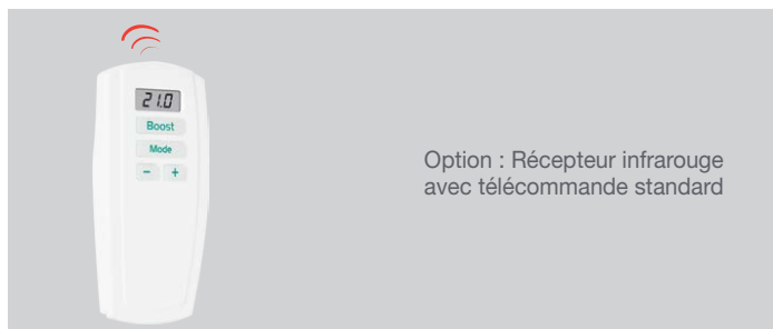
Option : Récepteur infrarouge avec télécommande standard