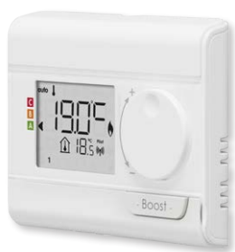
Télécommande radio en option