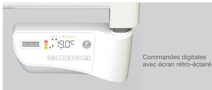
Commandes digitales avec écran rétro-éclairé