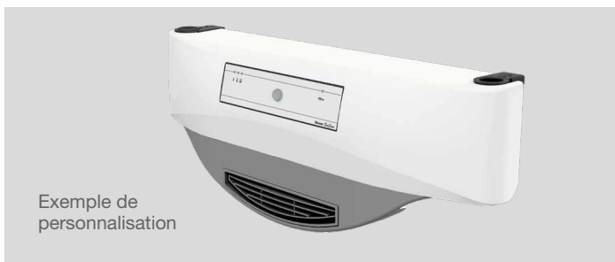
Exemple de personnalisation