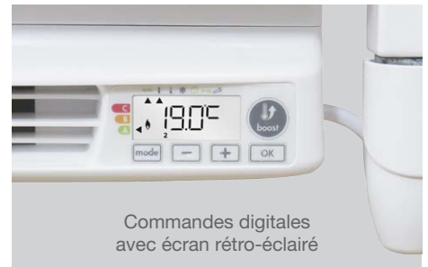
Commandes digitales avec écran rétro-éclairé