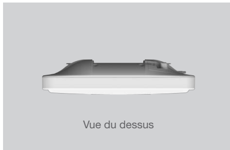
Vue du dessus