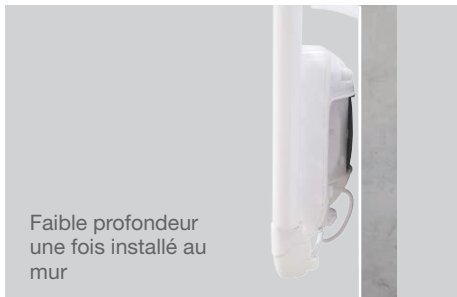
Faible profondeur une fois installé au mur