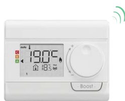
Télécommande RF optionnelle