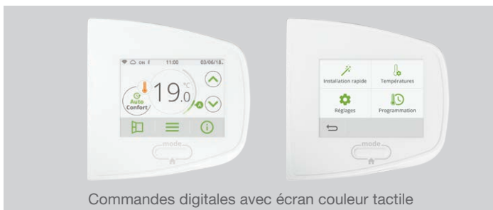
Commandes digitales avec écran couleur tactile