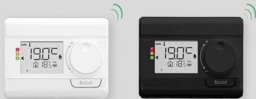
Télécommande radio (en option)