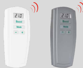
Télécommande infrarouge (en option)