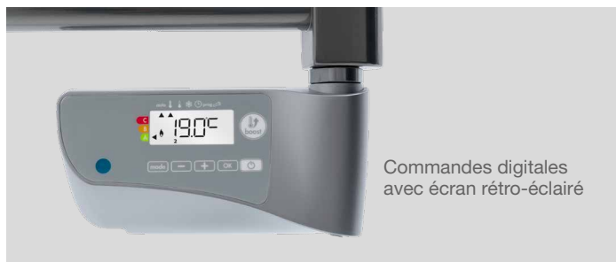
Commandes digitales avec écran rétro-éclairé