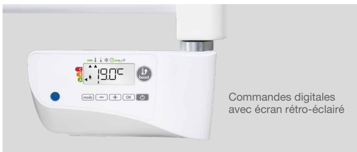
Commandes digitales avec écran rétro-éclairé